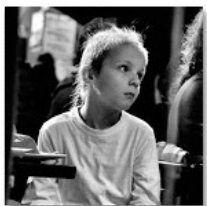
Open Mic POTRVÁ #59