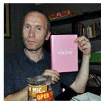
Open Mic POTRVÁ #57