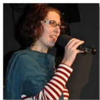
Open Mic POTRVÁ #58